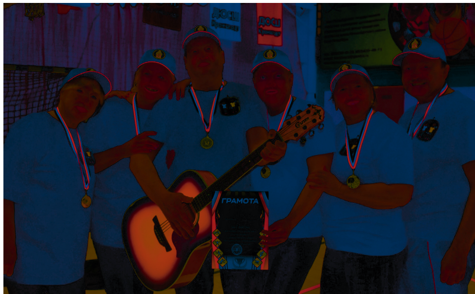
Дебютант Фестиваля и победитель - сборная команда 47-й пожарно-спасательной части «Активные гипертоники»

На прошедшей неделе в зале спортивной школы, впервые в Кронштадте, проходил Фестиваль спорта и творчества «А, ну-ка бабушки, а, ну-ка, дедушки». Спортивно-развлекательное мероприятие в рамках осеннего этапа Спартакиады «Старшее поколение» объединило шесть команд самых активных пенсионеров нашего города.