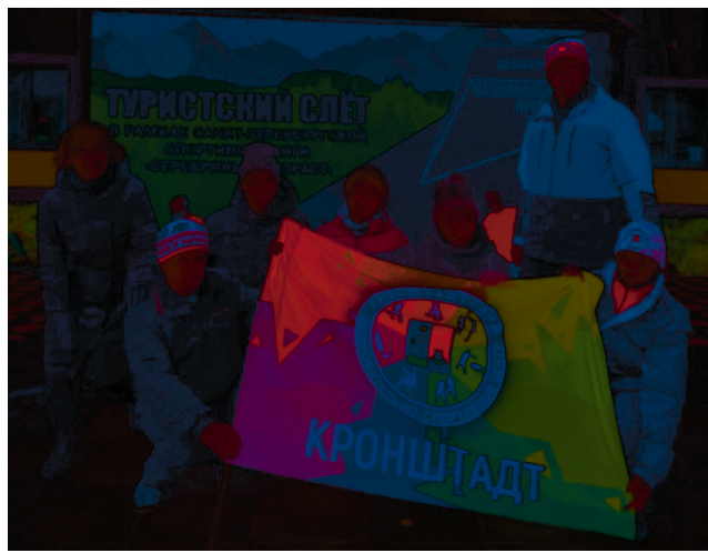
Сборная пенсионеров Кронштадта на «Туристском слете» в Зеленогорске

- Участвую в подобном фестивале не первый раз. Очень доволен, что наша команда «Котлин» вошла в призы. Правда, готовиться времени не было. Стихи выучил, а тренировки не удалось посетить. Практически экспромт получился: знакомился с заданием и выполнял его почти одновременно. К следующим стартам подготовлюсь и результат командный будет выше.