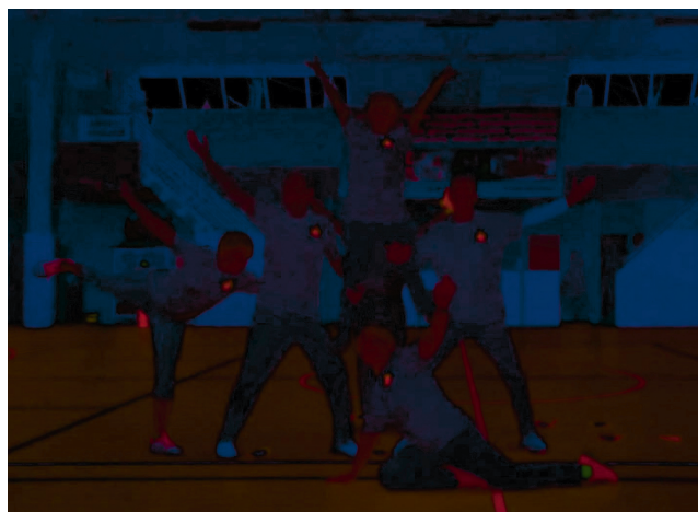
Гимнастическую пирамиду на творческом конкурсе исполняет команда «Поколение старших»